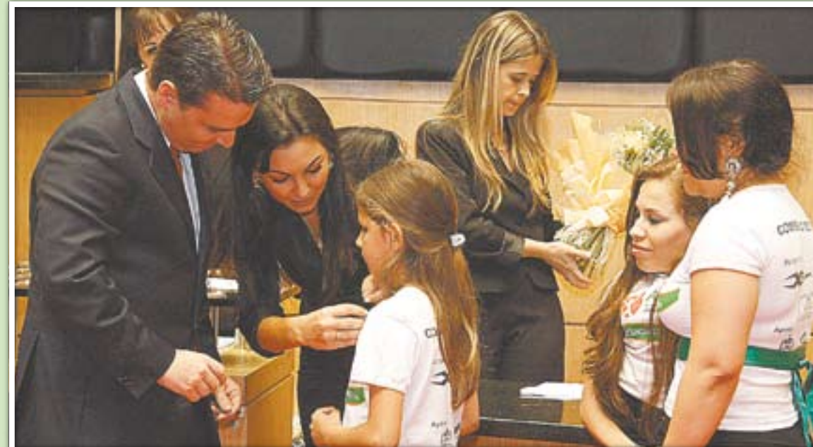
Crianças e jovens adolescentes da Associação Catarinense de Esportes Adaptados recebem condecoração