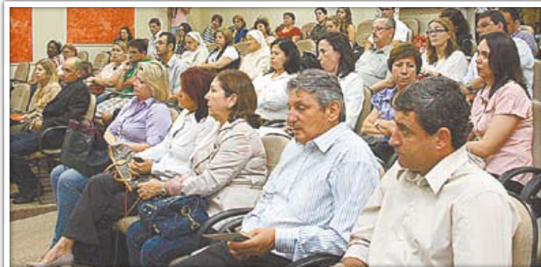
Autoridades políticas, universitárias e médicos acompanham a reunião