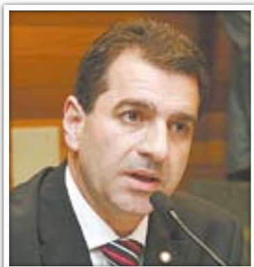
Cobalchini: contorno em Videira

do. Na mesma data, o governador entregará a ordem de serviço para pavimentação da ligação de Salto Veloso a Hercíliopolis e lançará edi-