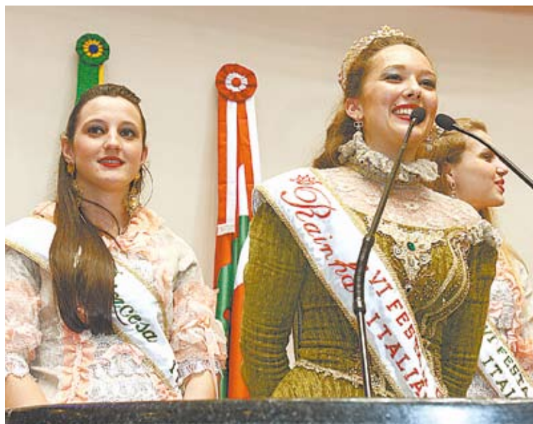
Rainha oficializa convite para parlamentares e sociedade catarinense

De acordo com os organizadores da festa, o evento resgata a cultura desses primeiros colonizadores, seus hábitos, religiosidade e formas de produção.