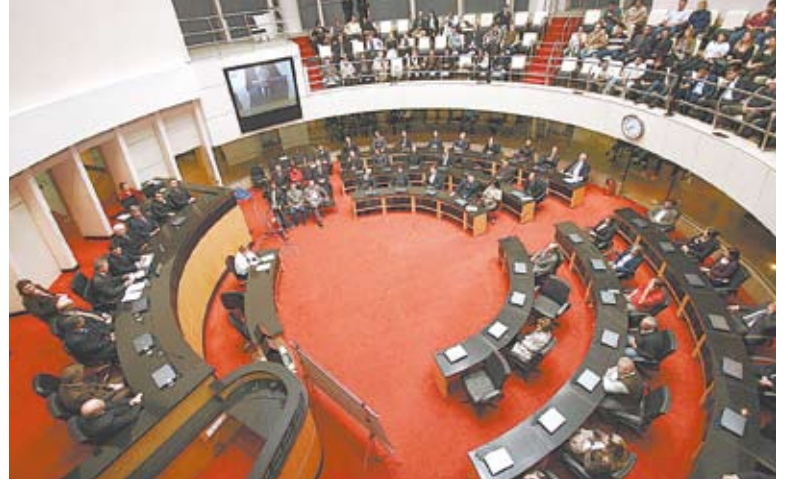
Sessão marca 25 anos da Federação das Associações