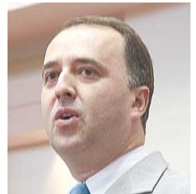
Kennedy: desabrigados em Ilhota

O deputado Kennedy Nunes (PP) protestou contra a Companhia de Habitação do Estado de Santa Catarina (Cohab) de Ilhota, no Vale do Itajaí, quanto à construção de casas para os desabrigados pelo desastre ambiental de 2008. "Fui pessoalmente ver como está a situação naquela cidade. A Cohab prometeu a construção de 65 casas e até agora não construiu uma sequer. É incompetência, é burocracia", disse.