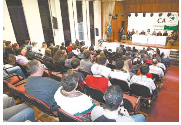
Audiência pública movimentada anfiteatro da Udesc, em Lages

As regionais de Lages e São Joaquim, que elegeram dia 21 a infraestrutura como prioridade para o Orçamento 2011, foram as últimas a serem consultadas na primeira etapa de audiências públicas do Orçamento Regionalizado, que esteve em São Miguel do Oeste, Maravilha, Chapecó, Joaçaba, Caçador e Canoinhas. As reuniões serão retomadas dia 31, quando a população da Grande Florianópolis será ouvida em São José.