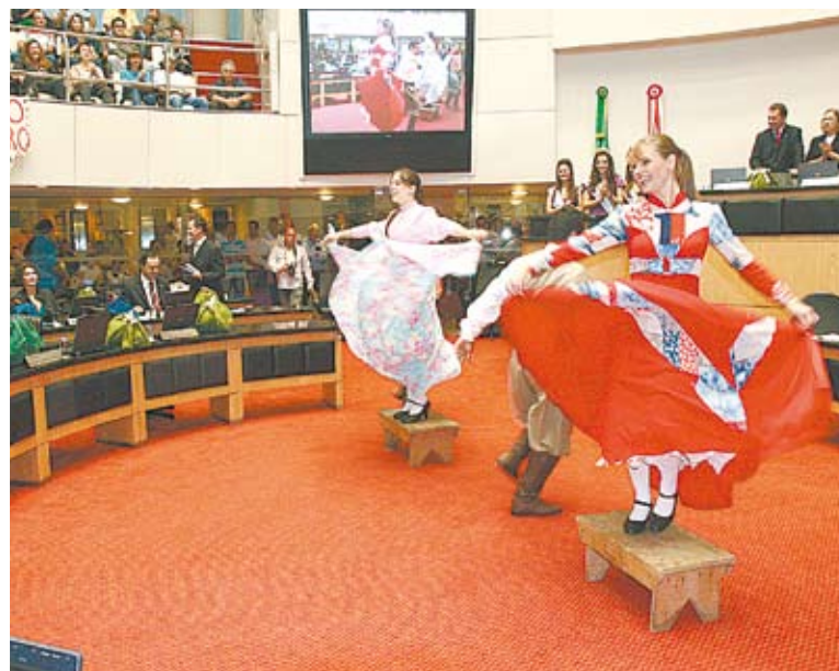
Grupo Barbicacho Dança Show se apresenta no Plenário da Assembleia

de dança folclórica com tradição gauchesca. Os principais atrativos são os shows artísticos nacionais e a gastronomia típica da região serrana, que oferece diversos pratos feitos com a semente do pinheiro-araucária, os mais conhecidos são a paçoca de pinhão e o entrevero. Além dos shows nacionais, cerca de 285 talentos regionais devem estar na 18ª Sapecada da Canção Nativa e 10ª Sapecada da Serra.