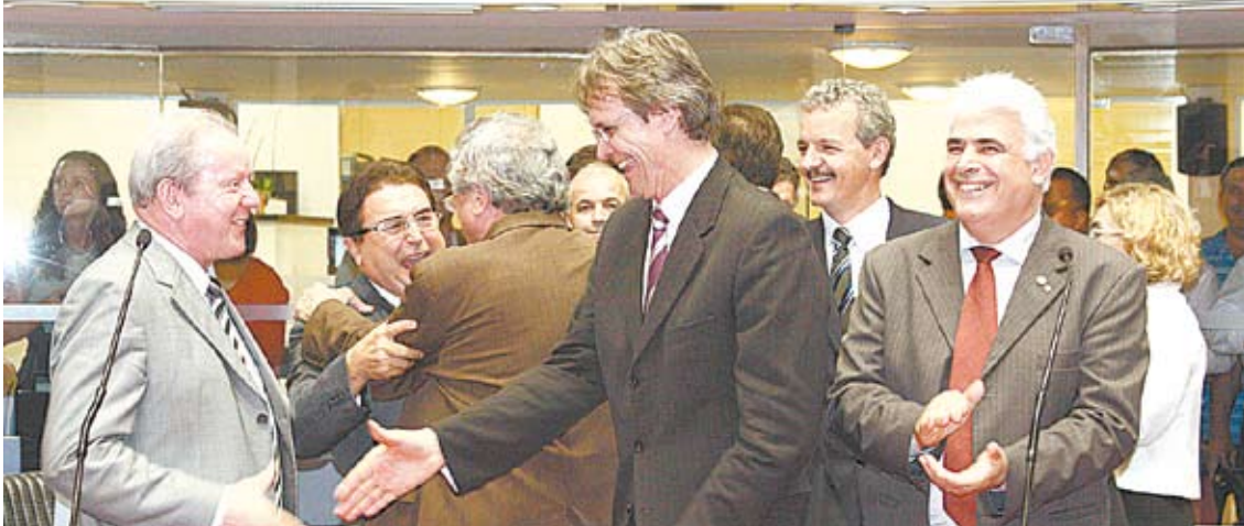
Deputado Pedro Uczeni, autor da proposta de emenda constitucional, cumprimenta colega Marcos Vieira

A Proposta de Emenda Constitucional (PEC) 3/2010 foi aprovada na sessão ordinária do dia 25, por unanimidade, com 24 votos em primeiro e segundo turnos e aprovação da redação final. A PEC, de autoria do deputado Pedro Uczeni (PT), determina que qualquer transferência de controle acionário de empresas públicas dependa de autorização legislativa, com posterior referendo popular.