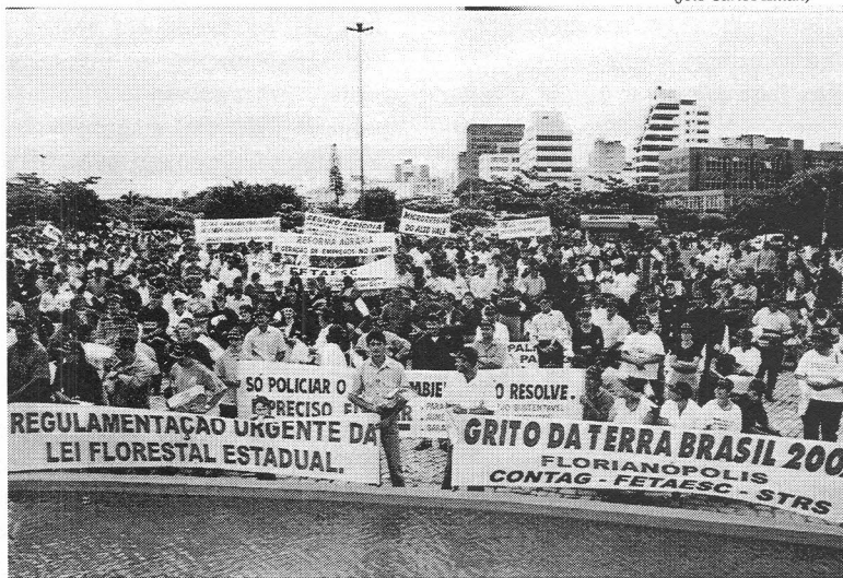
Concentração na Praça Tancredo Neves