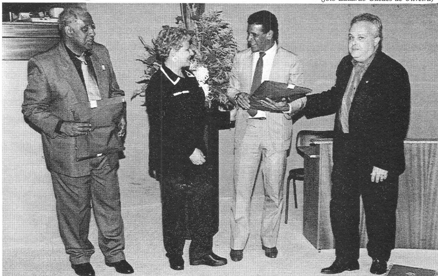
Ex-jogadores foram presenteados