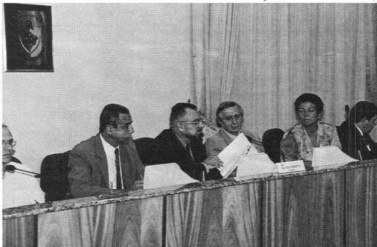
A audiência foi realizada na Câmara de Vereadores

Para o deputado João Macagnan (PFL), essas definições vêm colocar um ponto