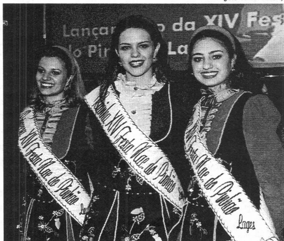
Rainha e princesas da festa