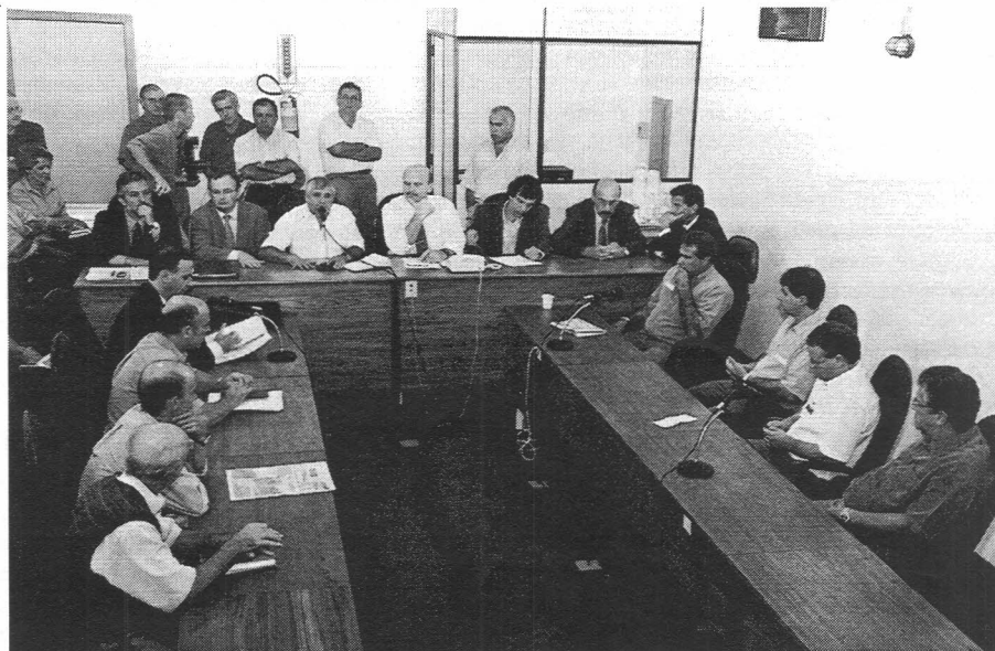
Deputados recebem ceramistas na AL