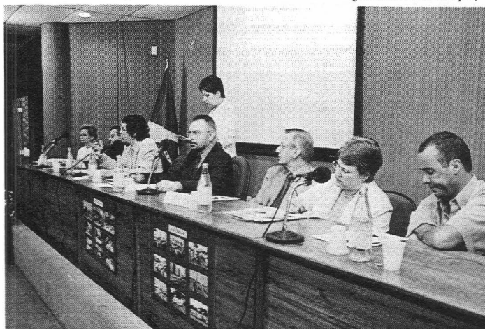
Comissão de Saúde promoveu o debate

Do evento que teve a participação de representantes das secretarias de Agricultura, Saúde e Educação, da Vigilância Sanitária, do Ministério Público, indústria alimentícia, supermercadistas, hotelheiros, médicos gastroenterologistas, pediatras e nutrólogos, foram retiradas al-