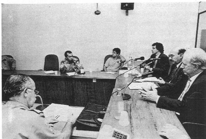
Parlamentares acompanham depoimentos