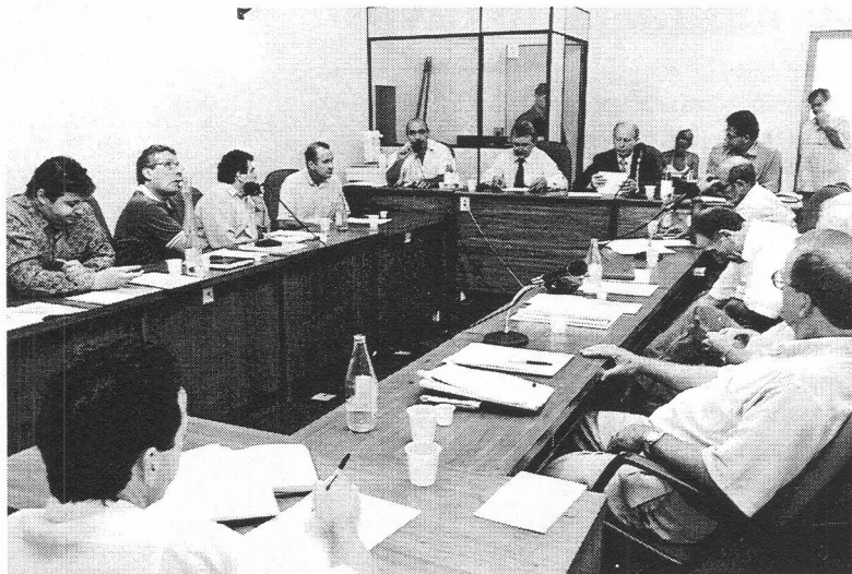
Parlamentares e técnicos do Paraná e Santa Catarina reunidos na CPI

A CPI do Leite vai defender a proposta elaborada pela Frente Sul de Agricultura Familiar na audiência pública que se realiza no dia 30, no Ministério da Agricultura, ampliando os prazos de vigência para as exigências da Portaria 56. A Portaria, discutida desde 1997, implementa uma série de exigências técnicas e sanitárias visando à qualidade do leite. O documento com as propostas foi ratificado pelos técnicos e parlamentares do Paraná e Santa Catarina, reunidos na manhã desta quinta-feira (25).