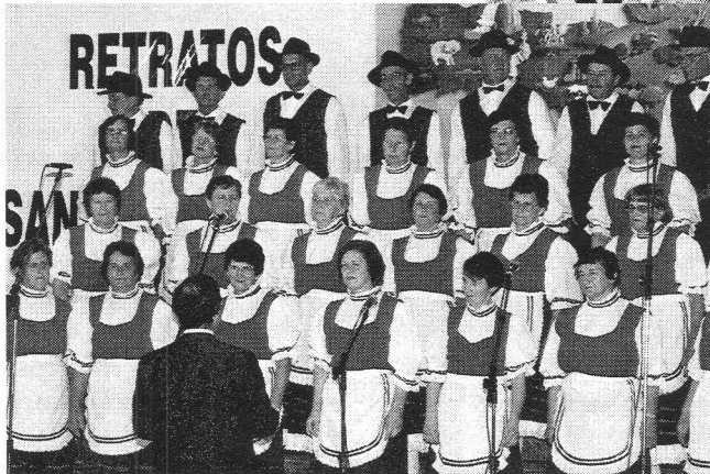
Apresentação do coral do município

soas que buscam soluções para os mais diversos problemas de saúde. Ele disse que os estudos da UFSC comprovam na região a presença de