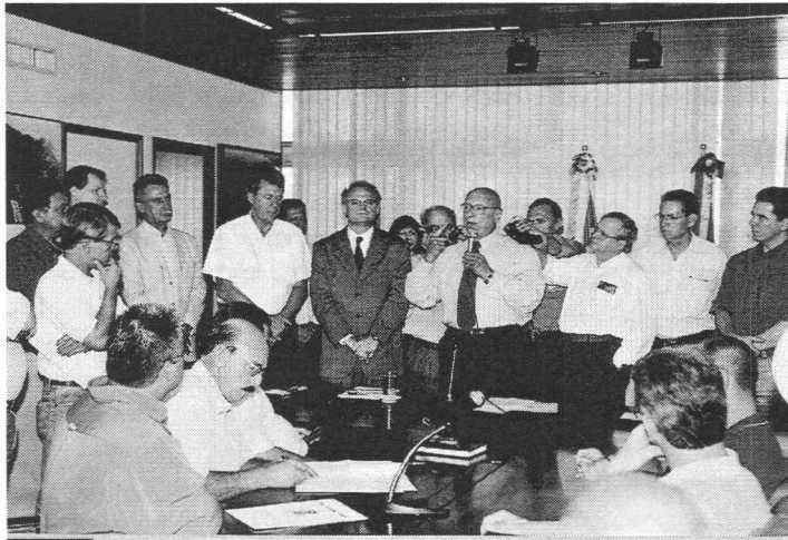
Deputados e lideranças do sul no palácio do governo

A Comissão Pró-Duplicação da BR-101 foi informada nessa segunda-feira (4) que em 12 de março será publicado, no Diário Oficial da União, o aviso de audiência pública que deflagrará o processo de licitação da obra. A notícia foi dada pelo ministro interino dos Transportes, Aldérico Lima, ao governador Esperidião Amin e repassada aos membros da comissão e autoridades que estavam presentes à audiência realizada no Palácio Santa Catarina. Participaram do encontro os deputados que formam a bancada do Sul do Estado. O trecho da BR-101 que falta ser duplicado vai de Palhoça (SC) a Osório (RS).