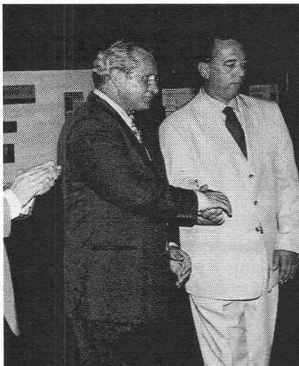
Presidente, reitor e vencedores do concurso