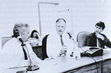
Mosena fala aos deputados

Os membros da CPI explicam que 60 mil produtores rurais têm na atividade leiteira sua principal fonte de renda e que qualquer medida econômica ou política, que favoreça as importações de leite e derivados, trará sérios prejuízos às indústrias, principalmente aos pequenos laticínios.