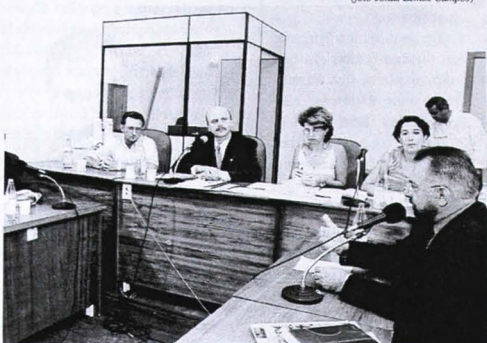
Comissão de Saúde recebe técnicos do governo

Santa Catarina possui até o momento, segundo documentos apresentados, 337 casos suspeitos notificados, sendo que 80% foram confirmados. Até agora todos os casos são de pessoas que viajaram para outros estados, como o Rio de Janeiro, onde há uma epidemia. Confirmada a identificação de 59 focos do mosquito aedes egypti , transmissor da