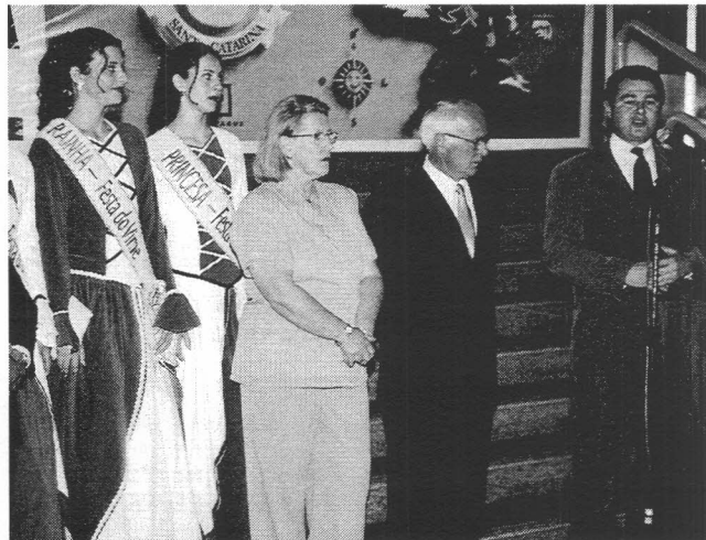
O deputado Sandro Tarzan (PPB), 2º vice-presidente da Casa, destacou o trabalho desenvolvido pelos moradores de Rio Rufino e ressaltou que é um orgulho para a Assembléia poder difundir a cultura do povo catarinense

Conhecida como a Capital Nacional do Vime , sua principal fonte de renda, e localizada na região serrana, no Vale do rio Canoas, a cidade é considerada uma das mais belas paisagens do Estado, com ocorrência de neve e geada durante o inverno. A agricultura familiar, a plantação de milho, de feijão e de fumo e a criação de gado de corte e leite têm participação importante na economia.