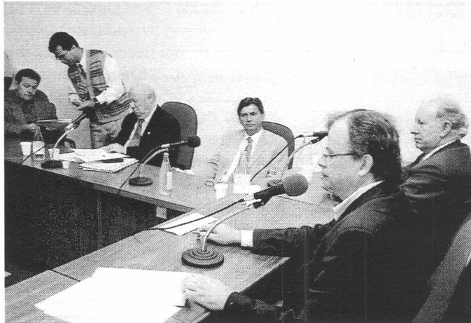
Reunião da Comissão

se 300 para o Orçamento do Estado e 600 para o Orçamento Regionalizado, que totalizaram R$ 67,39 milhões. Para o OR foram definidos R$ 53,54 milhões. As individuais incluem obras nas áreas de saneamento básico, saúde, sistema viário, contenção de cheias, trabalhos com idosos, adolescen-