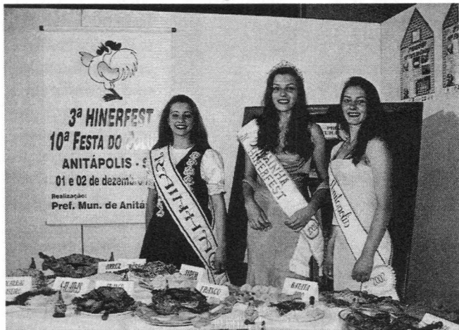
As rainhas da Festa

Dentro do projeto Retratos de Santa Catarina, que há vários meses vem sendo desenvolvido pela Assembléia, mais dois municípios fizeram suas apresentações no hall do legislativo nessa semana