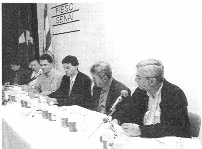
Deputados presentes à audiência