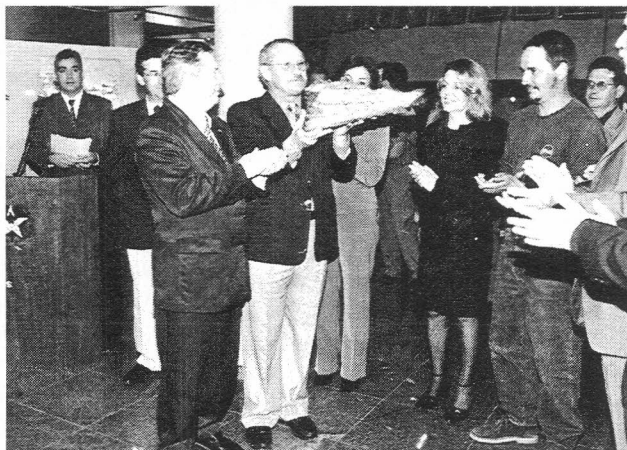
Deputados e autoridades presentes

Conhecida como a "Cidade da Neve", São Joaquim, com cerca de 22 mil habitantes, popularizou-se nacionalmente pelos espetáculos proporcionados no inverno que atrai turistas