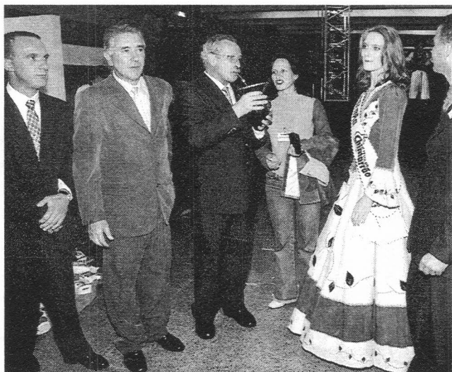
Pré-lançamento da Festa do Chimarrão

Catanduvras, situada no Vale do Rio do Peixe, com cerca de 8.500 habitantes, é a Capital Catarinense do Chimarrão . Cinco indústrias ervateiras estão instaladas no município, contribuindo para a geração de empregos e impostos, além de difundir a tradição do nativismo. Essas indústrias estão investindo cada vez mais em tecnologia para aprimorar o processamento da erva-mate e assim bene-